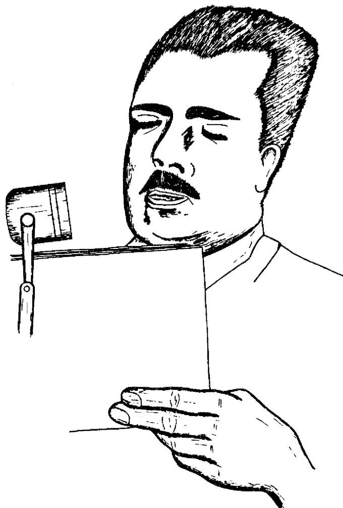
"L'action de nationalisation des hydrocarbures menée par le président Lazaro Cardenas en 1938 (...)"

L'action de nationalisation des hydrocarbures menée par le président Lazaro Cardenas en 1938 s'inscrit donc dans une perspective politique, celle de supprimer ce phénomène d'enclave, en récupérant une richesse nationale, non renouvelable, à la fois mal exploitée et mal utilisée par le Mexique. Elle s'inscrit aussi dans une optique économique: prendre en charge l'exploitation pétrolière pour enrayer son déclin, et maintenir un niveau de production capable de satisfaire une demande interne qui commence à se développer à cette époque (progrès de l'industrie et de l'automobile). La nationalisation se traduit par un redéploiement total de