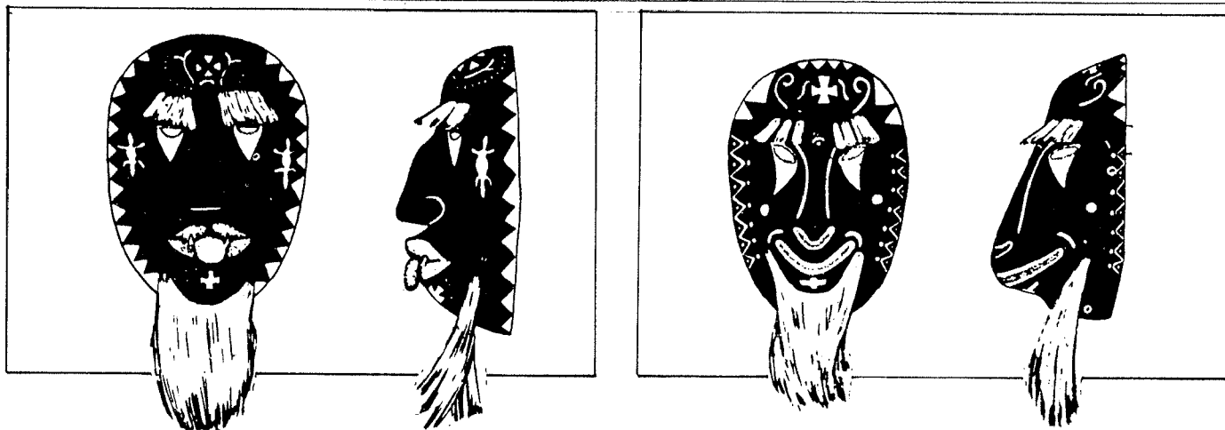
Máscaras de Pascolas (según Spicer 1954).

En el templo, el tambor y la flauta parecen hipnotizar a