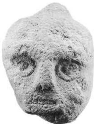
Photo 3 - Tête aux yeux circulaires, dents rehaussées d'incisions et petite protubérance au-dessus de la tête (hauteur: 13 cm). (Photo: R. Ávila).

la pluie, Tlaloc, ancienne divinité du panthéon mésoaméricain); elle appartient à une sculpture à tenon et qui a la particularité d'avoir un petit "chignon" sur la tête (élément qui se retrouve sur deux autres sculptures du type "sculptures-blocs", celles aux traits généralement peu ébauchés) (hauteur: 19 cm; largeur: 16 cm; épaisseur: 12 cm) (sculptures 4, 5, 8).