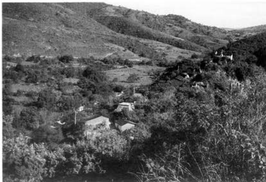
Figura 1 - Paisaje de Potoichan (municipio de Copanatoyac).

En este lapso de tiempo, las colonias crecieron como hongos: la Montaña desparrama su gente por la ciudad bordeada por el río, y se queda allí, en torno al Jale, 5 punto de encuentro entre ciudad y campo. Primero, se va a Tlapa para estudiar, hacer negocios, hacer trámites administrativos; después, de allí se sale hacia cualquier destino. Así mismo es práctico, tal vez hasta prestigioso, disponer de un alojamiento aunque sea precario. Las formas de ocupación de ciertas viviendas agarradas del monte muestran que toda la familia está interesada, en un momento u otro, por el alojamiento en la ciudad.