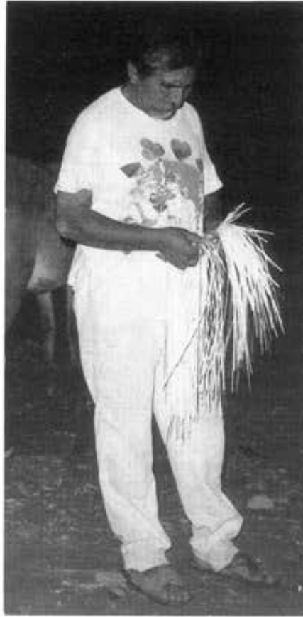
Figura 3 - Sombreros de palma real (Copanatoyac).

Conviene subrayar que, a todos los niveles, los interesados mienten sobre los precios (pagados o recibidos); todos tratan de realzar su propio protagonismo en una cadena que, visiblemente, sólo proporciona beneficios importantes a los exportadores,