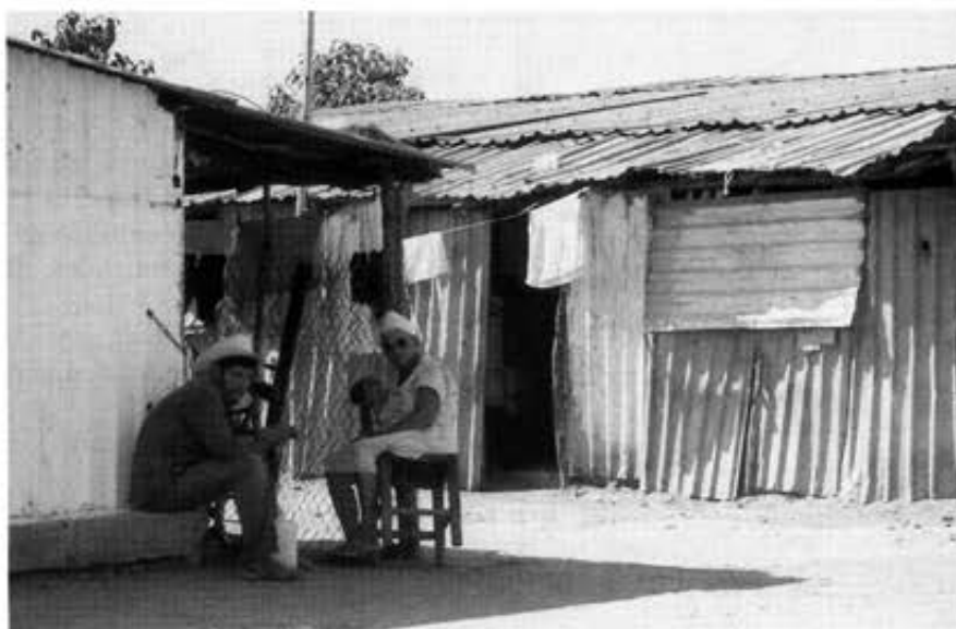
Figura 2 - Galerones en Culiacán, destinados a los jornaleros.

Si bien varios estudios sobre el medio rural mexicano han demostrado que la migración, tanto estacional como de larga duración, es parte de la vida e incluso de la organización de las familias rurales, parece necesario también interesarse por las posibles actividades dentro del medio rural de origen. Entre éstas, la artesanía es conocida como un com-