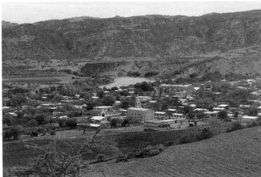
Figure 1 - Paysage de San Agustín Oapan et du fleuve Balsas. Partie de la retenue prévue.

Si tout le monde s'accorde avec Raisz (1959) pour délimiter cette partie du bassin du nom de "Bal-