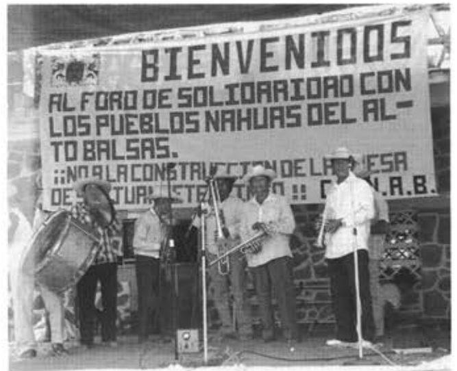
Figure 2 - Forum de Solidarité avec les villages nahuas du Haut-Balsas.

Dans ce contexte, il est frappant de voir à quelle vitesse cette nouvelle définition de “Nahuas du Haut-Balsas” se propage et le succès qu’elle rencontre. C’est tout d’abord par un manifeste d’une page publiée dans La Jornada (l’un des principaux quotidiens mexicains), le 18 février 1991, que les villages d’artisans amateros et leurs frères nahuas de Copalillo renaissent en tant que “Nahuas du Haut-Balsas” aux yeux du grand public et des journalistes. Dans ce texte, ils proclament leur opposition argumentée au projet hydroélectrique 8 . Le manifeste étant signé par le Grupo de los Cien —Groupe des Cent, qui réunit des personnalités mexicaines de renom, artistes, écrivains et scientifiques généralement associés dans des protestations écologiques et patrimoniales—, ils gagnent d’emblée la reconnaissance médiatique et la redéfinition de leur action sur la base du groupe ethnique.