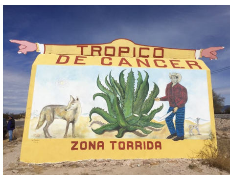
Figure 11 – Peinture murale sur le marqueur du tropique du Cancer.

et décoré avec des motifs d'inspiration huichol (voir les Figures 11, 12). Peinte par divers artistes, dont un muraliste wixárika, plusieurs Catorceños et quelques étrangers, cette œuvre collective, inaugurée en 2015 ( https://hijosdelatierra.espora.org/tropico_cancer_catorce/ ) faisait partie des nombreuses actions politiques et culturelles de défense de Wirikuta dans le contexte d'un conflit avec de grandes sociétés minières (Guzmán et Kindl, 2017 : 217-265). Une démarche similaire a stimulé la réalisation d'un court-métrage d'animation intitulé Kauyumari, le Cerf Bleu , 6 où ce dernier, recouvert de perles multicolores, guide le spectateur à travers le paysage de Wirikuta.