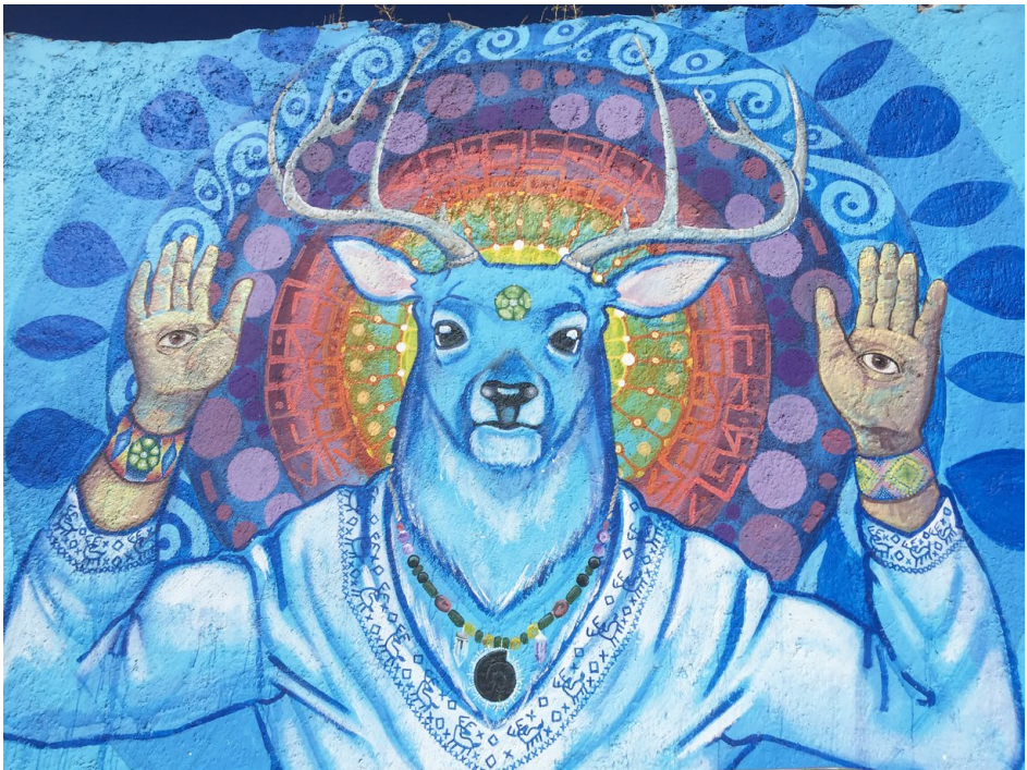
Figure 10 – Fresque représentant Kaenyumari peinte par un voyageur sur la façade d'une maison. Lieu : San José de Coronados (Catorce), San Luis Potosí. Photographie : Olivia Kindl, mars 2018.