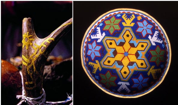
Figure 6 – Bois de cerfs rituels, peints avec une figure de cerf à l' uxa . Photographie : Olivia Kindl, 2000.

Par ailleurs, nous retrouvons ce personnage sur le même territoire mais dans des contextes distincts, ornant les maisons des habitants locaux (voir la Figure 10). Ces peintures murales, extérieures ou intérieures, sont élaborées par les touristes voyageurs néo-Indiens (Galinier et Molinié, 2006), néo-chamanes, New Agers ou psychonautes. 5 Ils réalisent ces fresques sous l'inspiration de leurs expériences vécues dans le désert magique, et parfois leurs œuvres servent aussi comme un moyen de paiement pour prolonger leur hébergement chez l'habitant en cas de manque d'argent.