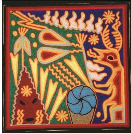
Figure 2 – Kauyumari. Tableau de fils de S. Eleuterio L., Tepic (Nayarit).