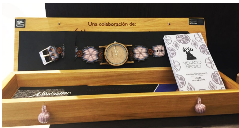
Figure 14 – Bracelet-montre en bois et perles tissées avec motifs huichol de peyotl, de la marque « Venado Negro », México.

Wahaa ait été dissous depuis quelques années en raison de dissension internes, le cerf et le peyotl continuent leur mouvement de diffusion et d'expansion sur la planète, comme en témoignent par exemple ces créations de mode ethnique sur les étalages de boutiques de luxe à Mexico et ailleurs (voir la Figure 14).