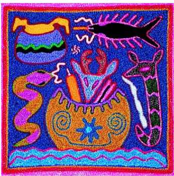
Figure 4 – Bois et peau de visage de cerf dans l'attirail rituel de la Fête du Peyotl.