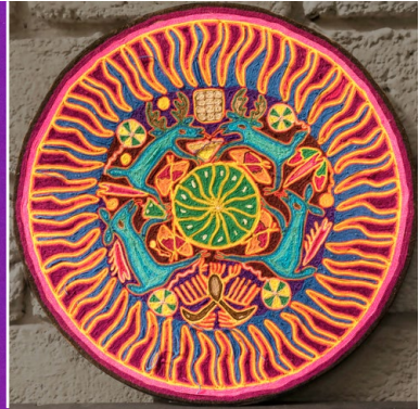
Figure 9 – Tableau de fils avec cerfs de couleur bleue. (ca. 2003) Collection privée. Photographie : Carlo Bonfiglioli, 2019.