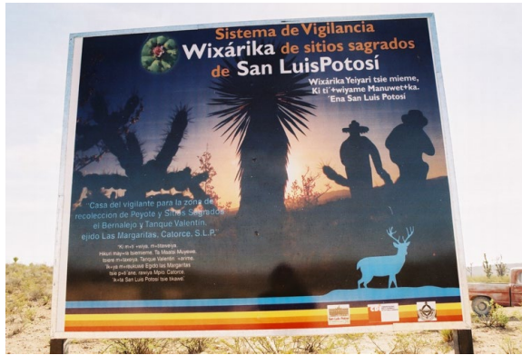
Figure 13 – Panneau du système de surveillance des sites sacrés de Wirikuta. Photographie : Olivia Kindl, 2013.

que territoire sacré, dont les deux principaux emblèmes sont justement la figure de Kauyumari et celle du peyotl, jusqu'à en devenir de véritables stéréotypes. Nous le constatons par exemple sur ce panneau de système de surveillance des sites sacrés de Wirikuta (voir la Figure 13), où apparaissent les logotypes du peyotl (en haut, à gauche) et de la silhouette d'un cerf bleu (en bas, à droite).