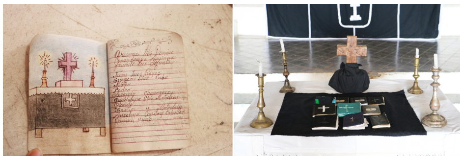
Imagen 3 - Izquierda. Libro de ánimas de la señora María Faustina. Derecha. Libros de ánimas que se llevaron a la misa efectuada el 2 de noviembre de 2017.

incógnitas y constituir una mina de indagación antropológica, solamente han dado lugar a dos estudios relevantes desde un enfoque lingüístico o literario. El de Aracil (2004) busca establecer, mediante una comparación entre el manuscrito de Quinceo ( Tlalocan I, 1944: 123-169) y el de Charapan ( Tlalocan II, 4, 1948), cuál sería la línea evolutiva más próxima a la definición actual del género (literario). El de Nava (2001) se interesa en identificar los elementos de la cultura, las concepciones y expresiones lingüísticas de los purépechas actuales presentes en el texto de Pichátaro (León, 1906: 436-452).