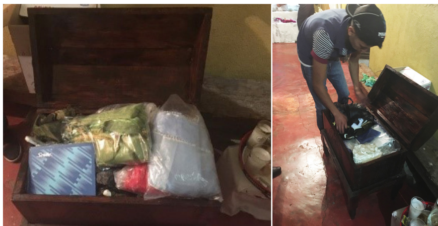
Imagen 6 - El baúl de madera donde se guarda el libreto junto con los trajes del Niño Dios. Ihuatzio, diciembre de 2016.

oculta sino muestra sus indicaciones escénicas-, sino también los actores que así lo deseen, mientras están actuando. Es como si el libreto fuera un personaje que permanece ahí y se desplaza sobre el escenario a la vista de todos (Araiza, 2017).