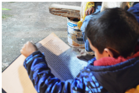
Imagen 4 - Una de las formas de vida del libreto: es leído, incluso por un niño que no participa todavía en la pastorela.

cutantes carecen de memoria escrita ¿cómo explicar que manifiesten tanto celo no solamente por preservar sus textos, sino por establecer con ellos una interacción duradera? Cabe preguntarse si realmente en la mayoría de localidades nunca se dispuso de una versión escrita, o sencillamente los investigadores no la han encontrado. 15 ¿Acaso el hecho mismo de que se le oculte, que se prohíba ser mostrado en cualquier momento y a cualquier ser humano, no sería una prueba de la capacidad de agencia del libreto? Lo cierto es que los antropólogos han soslayado al libreto o lo han considerado como un humilde sirviente al margen de la acción ritual, pues solamente es llamado para testificar sobre el significado de los símbolos, sobre el sentido de la acción que realizan los demás participantes humanos, pero no para hablar por sí mismo sobre sí mismo. ¿Cómo son tratados los libretos, cómo y dónde se les guarda, qué lugar ocupan en el curso de realización del ritual y qué nos dice todo esto sobre el tipo de efectos que se desea provoque el ritual o la danza? En un sentido más profundo ¿qué nos dice esto sobre el tipo de sociedad que realiza estas danzas y utiliza estos libretos? En lo que sigue abordaremos estas cuestiones.