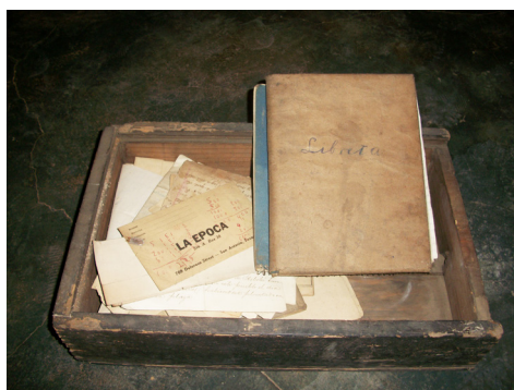
Imagen 2 - Caja donde se guardan los libretos de Comachuén.

La respuesta más común era: “no te puedo decir de esas cosas, está prohibido, pues”. Como veremos, esto se debe al modo particular en que son tratados los libretos, las prohibiciones de que son objeto. Así que por el momento no me queda más que aventurar que esta caja con estos libretos, que tienen huellas que revelan mucha antigüedad, bien pueden ser parte del repertorio de uno de los tres maestros de pastorela de Comachuén.