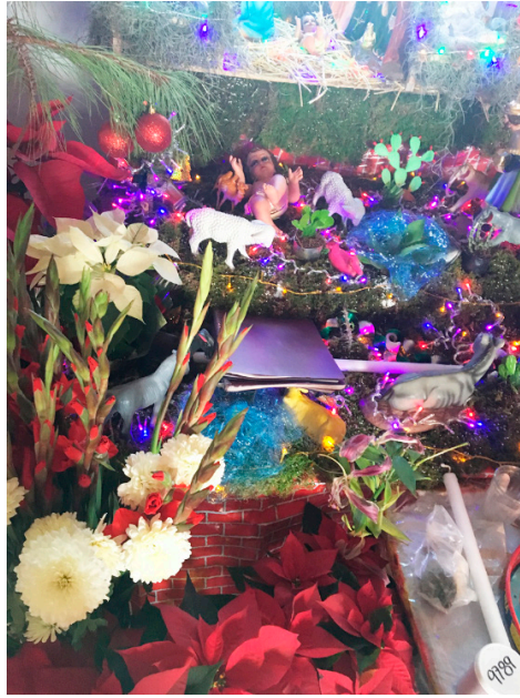
Imagen 5 - Un libreto colocado en el altar del Niño Dios. Ihuatzio, diciembre de 2016.

En contraste, una vez que se ha realizado este ritual que marca el inicio del periodo de ensayos de la pastorela, el libreto se vuelve omnipresente. Como señalé, se le coloca en el altar del Niño Dios; lo vemos en manos de muchachas y muchachos que van de un lado a otro por las calles de los dos barrios de este pueblo. Es un tiempo de relación estrecha, cuerpo a cuerpo, entre el libreto y el cuerpo de quienes participan en la pastorela. Esta relación es particularmente visible en cada atardecer y en la noche, mientras se realizan los ensayos y se extiende hasta el “ensaye real” (la première ) e incluso durante la representación principal. Que los actores lleven en sus manos el texto dramático mientras están actuando ante el público es algo que jamás ocurriría, o sería inaceptable, en las representaciones del teatro culto, el teatro urbano. En cambio, aquí, como en muchos otros poblados purépechas, es de lo más normal que se haga visible el texto en todo momento. Es como si el libreto cobrara vida. “No solamente el ensayador lo lleva en sus manos y lo exhibe —mientras se desplaza en el escenario como si él mismo fuera un personaje, que no