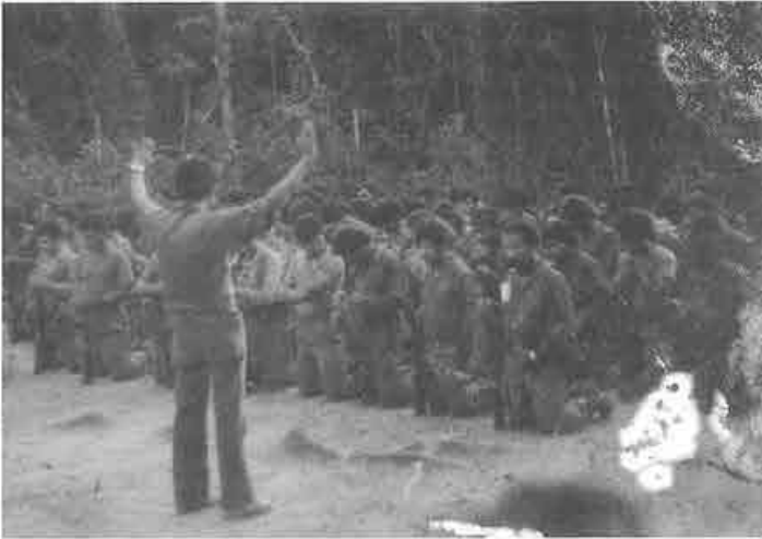
Rezando antes de una operación.

ya salí de la guerrilla –él también se sumó al campo de refugio–, un pastor que era de Saupuka; él anduvo muchos años conmigo, cada vez que yo salía con tropas, él salía conmigo. Él andaba armado y combatía y hacía canto entre nosotros. Todas las mañanas, cuando íbamos a caminar, hacía oraciones; toda la noche, cuando íbamos a dormir, hacía oraciones, cuando íbamos a salir a caminar, primero pedir al Señor, después vamos a caminar. Por allá, por el camino, él decía, “hermano vamos a descansar un poco, puede ser que el enemigo esté cerca y nosotros estamos caminando, estamos cansados, entonces nos puede agarrar débiles y entonces vamos a descansar un poco”; a los 20 minutos oíamos que estaba cerca el enemigo.