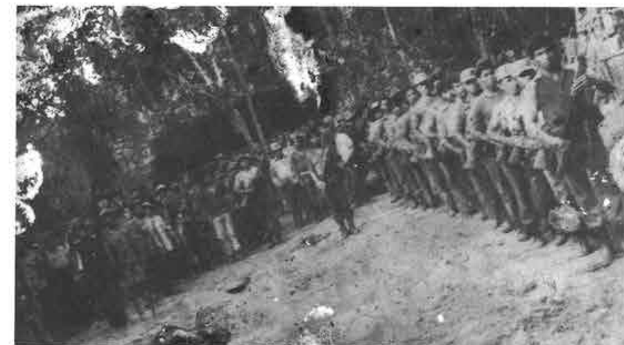
Los primeros grupos guerrilleros.

americano o argentino, nunca me permití preguntarle; pero era un extranjero.