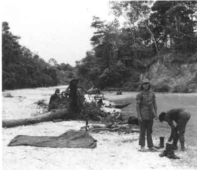
Baño en el río, 1984.