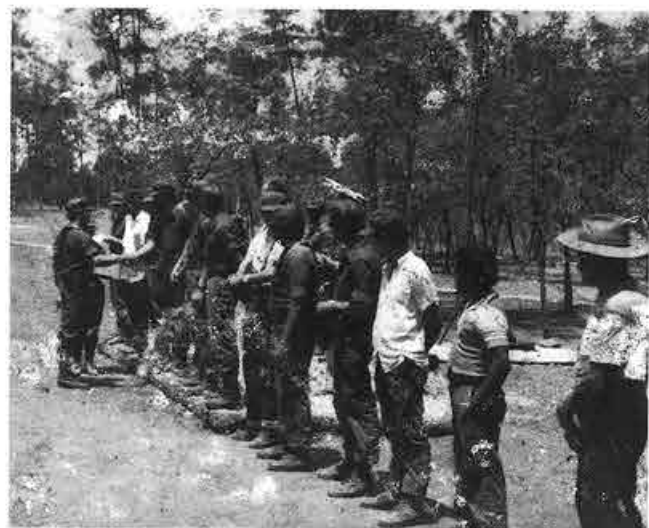
Reclutas en una base hondureña.

GB – ¿Tu zona, siempre fue en 1982 y 1983, entre Leimus y Sandy Bay?