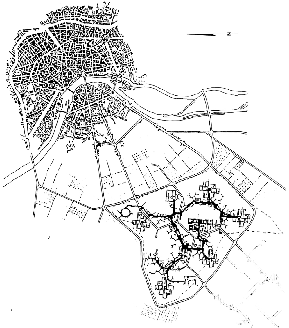
Figura 1 - Le Mirail, una Tolosa "bis" en el campo.

El territorio abarca 680 ha, 250 de las cuales debían ser destinadas a las áreas verdes, y el resto a la construcción de 25 000 viviendas, capaces de alojar a 100 000 habitantes.