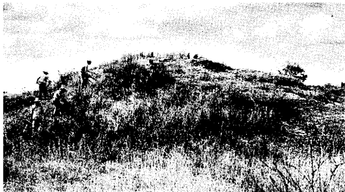
Figura 2 - Vista del sitio de Don Martín, Chiapas.

compactos y arqueológicamente estériles. La exploración se inició desde su entrada en la parte superior, vaciándose todo su contenido, el cual se cribó, tomándose diversas muestras para flotación (Fig. 3).