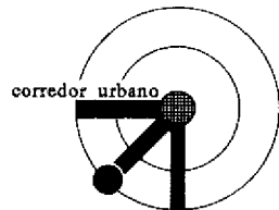
Nuevas localizaciones de la centralidad (áreas y ejes) (años 80)