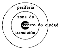
Centro de ciudad y centralidad se confunden (hasta los años 50)